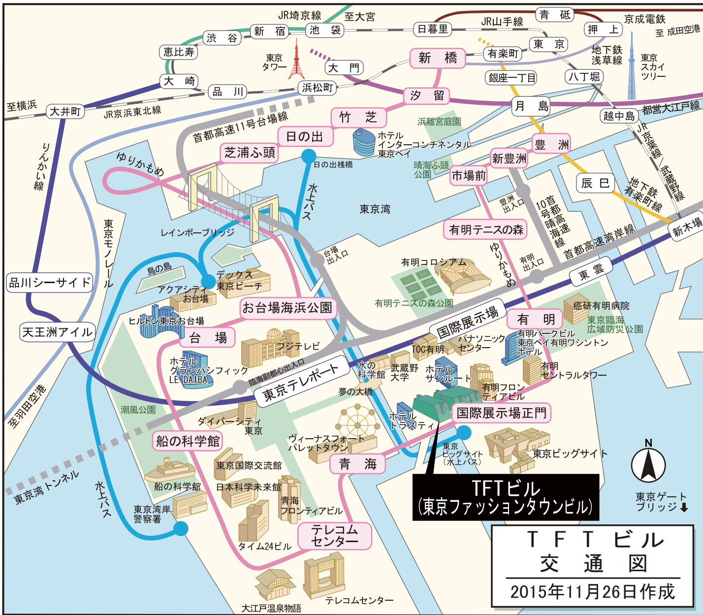
TFTビル 交通図 2015年11月26日作成